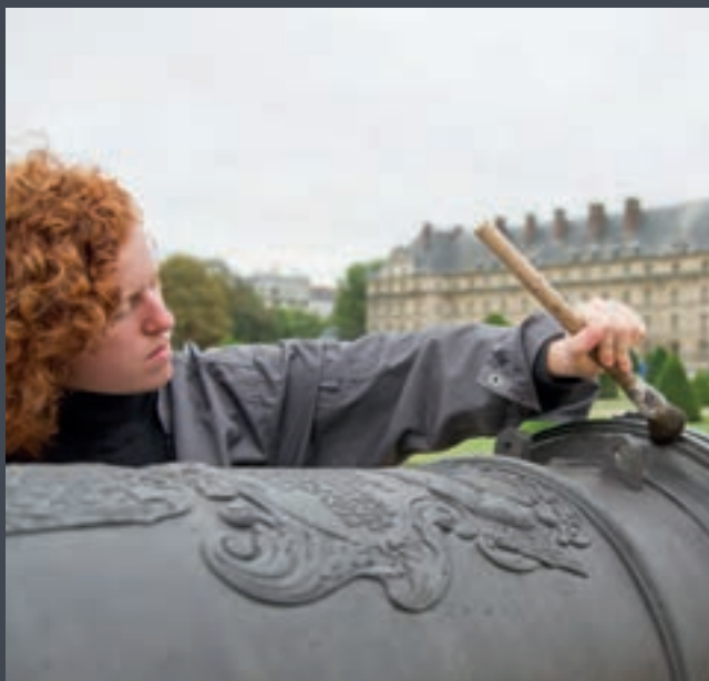
Restauration d'un canon de la batterie trophées.

Proposé sur support iPod Touch, il est pratique, facile d'utilisation et vous permet d'enrichir votre visite. Vous pourrez choisir entre les parcours chronologiques et les parcours thématiques. Il est disponible en huit langues.