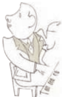
Portrait de Francis Poulenc par Jean Cocteau